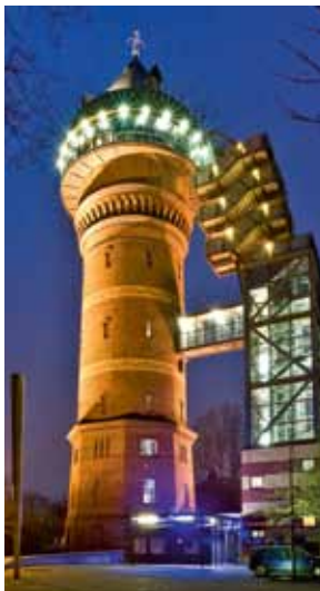
Aquarius Wassermuseum, Mülheim an der Ruhr

Apostelstr. 84, 47119 Duisburg Tel. 0203/80889-40 www.binnenschifffahrtmuseum.de Öffnungszeiten Museum: Di-So 10-17 Uhr 📍 Duisburg Thyssen Tor 30